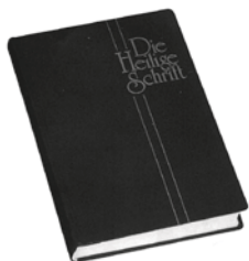
Abb. 2 – Die Bibel: das Buch der Bücher

»Seit wann interessierst du dich für solche Dinge?«, unterbricht ihn erneut seine Mutter. »Ist das jetzt ›in‹ oder suchst du nur eine Freundin dort?«